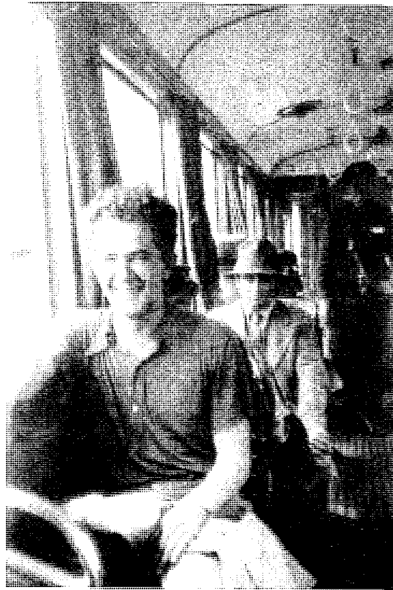
Milovan Đilas u beogradskom tramvaju 1938. godine

Sama Crna Gora je u toku pretprošlog veka imala dva imena, Njegoša kao pesnika, mislioca i modernizatora crnogorske države, i Marka Miljanova Popovića, heroja, mislioca i moraliste. Milovan Đilas u ovom prošlom XX veku predstavlja najveće ime Crne Gore.