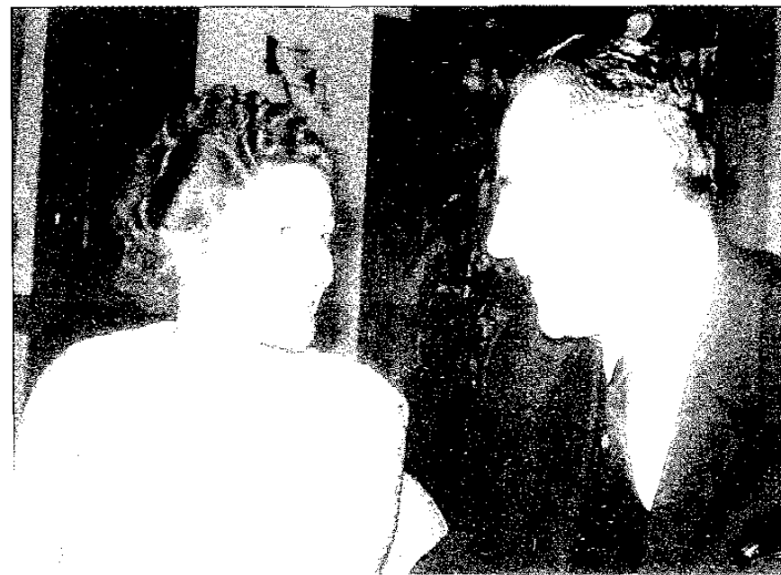
Svetlana Alulejeva, Staljin i Milovan Đilas u Njujorku 1968.