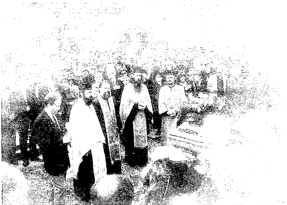
Sahrana Milovana Đilasa u Podbišću 1995.