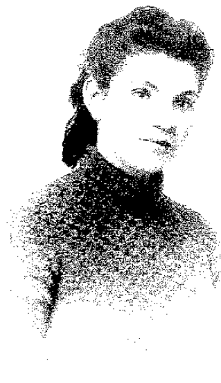
Dobrana Đilas (19.-1942)